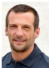
Abd Al Malik, Samuel Le Bihan, Mathieu Kassovitz

Toutes les infos sur www.festival-version-originale.fr et www.leprojetmoteur.org facebook/Insta/Twitter et toutes les vidéos du Concours Moteur! sur Youtube